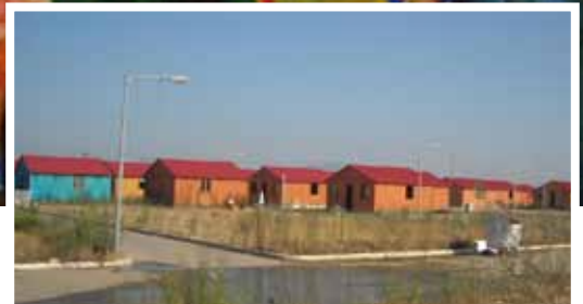
Προσωρινός Οικισμός περιοχής Μπιρμπίτα - Μεσσηνία