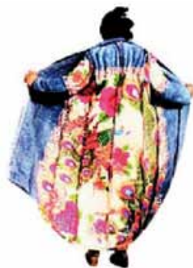
«Το Πανωφόρι των Ρομά» Έργο της Μαρίας Παπαδημητρίου ραμμένο από πολύχρωμες τσιγγάνικες κουβέρτες (εφημ Νέα 15.12.10)

Οι τοπικές αρχές μπορούν να συμβάλουν ώστε να γίνουν οι Ρομά κοινωνοί των πολιτιστικών αγαθών που απολαμβάνουν οι υπόλοιποι δημότες. Ενθαρρύνετε την ένταξη τους σε πολιτιστικές ή αθλητικές ομάδες και προσφέρετε ευκαιρίες για τη διεύρυνση των πολιτιστικών τους οριζόντων, πέρα από τα όρια της ομάδας τους.