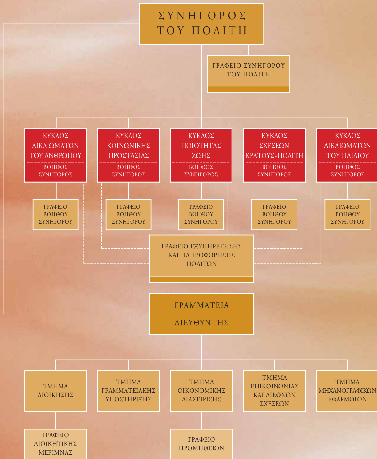
ΔΙΑΓΡΑΜΜΑ 2.1 ΟΡΓΑΝΩΤΙΚΗ ΔΟΜΗ ΤΟΥ ΣΥΝΗΓΟΡΟΥ ΤΟΥ ΠΟΛΙΤΗ