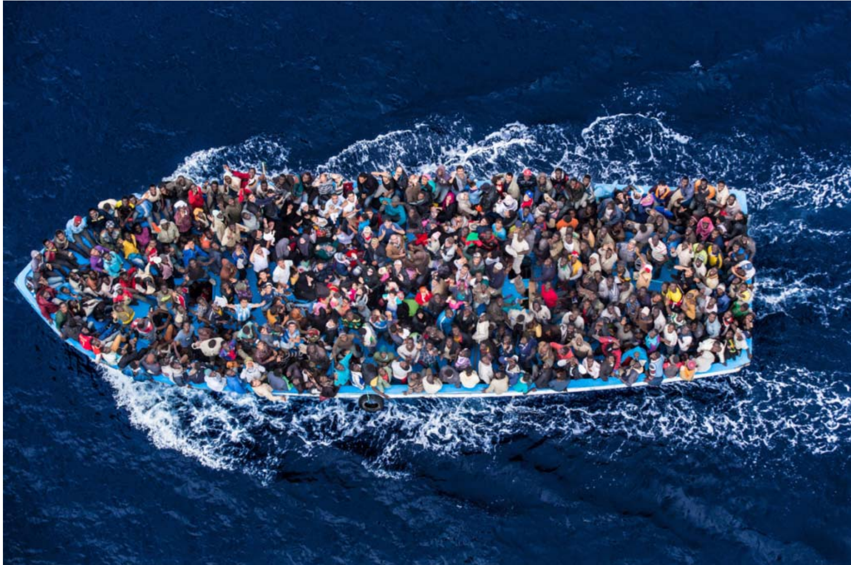
African asylum seekers packed into a boat.